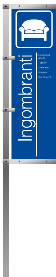
Palo con segnale singolo bifacciale

SISTEMA DI SEGNALETICA PER LE PIATTAFORME ECOLOGICHE