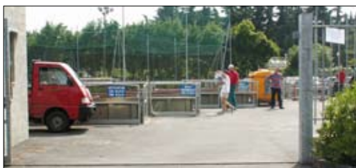
Segnaletica singola su pali.

Nella foto piccola il sistema tradizionale, nella foto grande il sistema da noi prodotto.