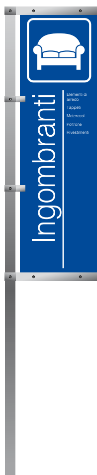
Palo con segnale singolo bifacciale

SISTEMA DI SEGNALETICA PER LE PIATTAFORME ECOLOGICHE