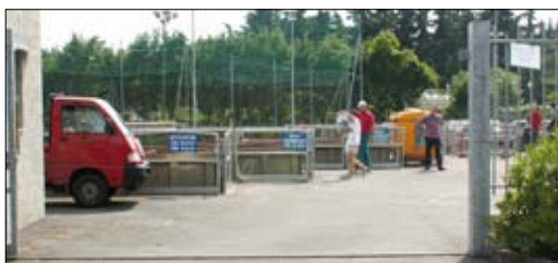
Segnaletica singola su pali.

Nella foto piccola il sistema tradizionale, nella foto grande il sistema da noi prodotto.