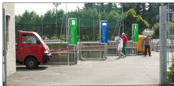
Segnaletica singola su pali. Senza e con il sistema da noi prodotto.