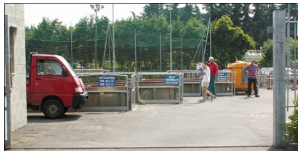
Palo con segnale singolo bifacciale