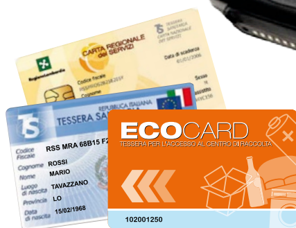
ECOPASS funziona con la Tessera Sanitaria Regionale e la Carta Regionale dei Servizi (già in dotazione agli utenti) o con l'ECO CARD (realizzata ad hoc per le ditte)