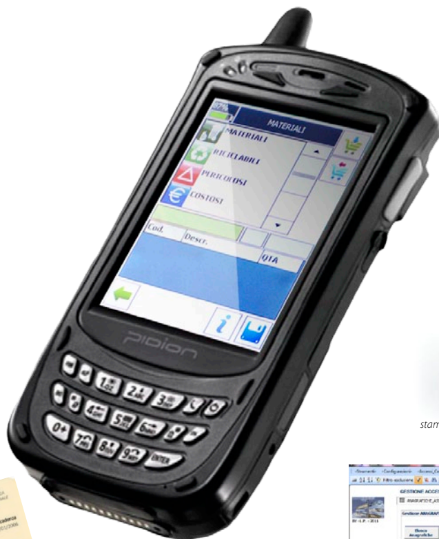
Palmare touch screen